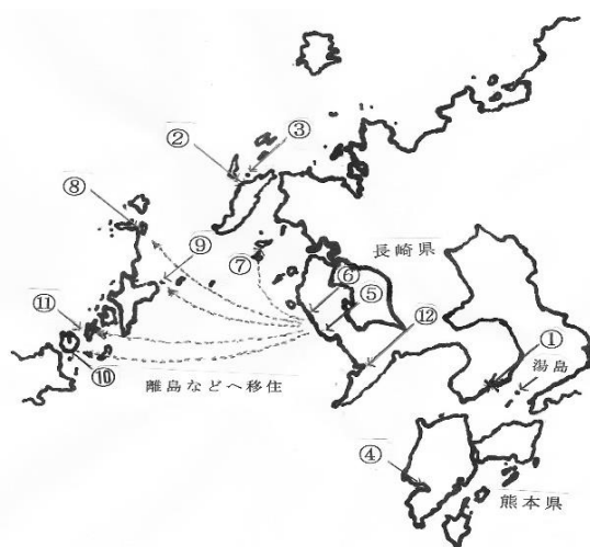
2018年度世界遺産登録が内定した12構成資産