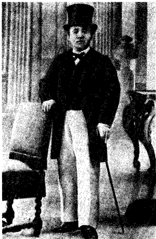
フロリヘラルトと渋沢栄一