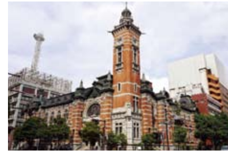
当会例会会場:横浜開港記念会館

横浜歴史研究会は昭和58年の創設以来、会員による古代から近代までの通史の研究発表並びにさまざまな歴史研究の活動を行っています。来る令和4年は創設40周年の記念大会を開催します。歴史や伝統芸能に優れた方々をお招きし、市民の方々と共に祝典をお楽しみいただきます。どうぞご期待ください。