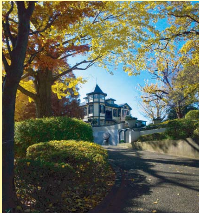
山手イタリア山庭園と外交官の家