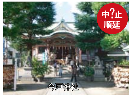
春の歴史散歩。江戸の光と影「裏浅草」