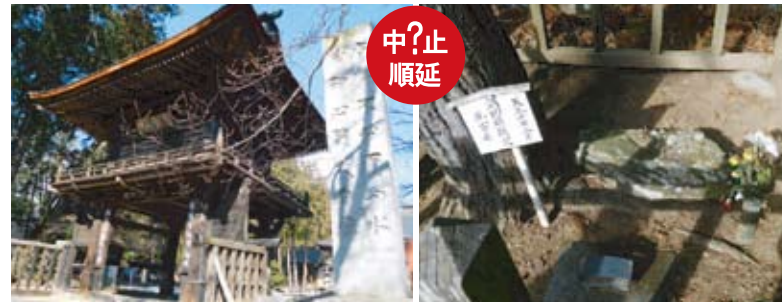
旅行委員が綿密なプランを立てていた5月武田緑りのバスツアー。残念無念の心頭は減却できず。(左)恵林寺、(右)景德院・勝頼生書石