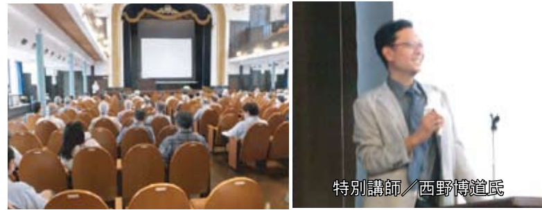
半年ぶりの再会、再開。9月例会は開港記念会館講堂での開催。