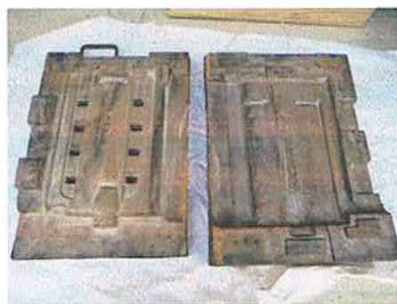
和製ジェラール押型(植竹氏所蔵)