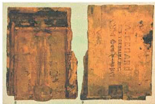
(横浜都市発展記念館 2005 転載)