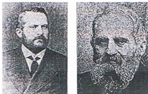
A.ジェラルール肖像写真

ヨコハマ・ウォーターと呼ばれたこの水は非常に良質で、赤道を越えても腐ることはない、と当時の船乗りの間では評判だったという。