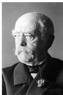
宰相ビスマルク